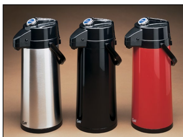
ThermoPro™ TLXA 2.2L Airpots. (Продается отдельно)

ООО "ГУРМЭ СТАЙЛ" представитель в РФ sales@gourmetstyle.ru 495-970-17-42